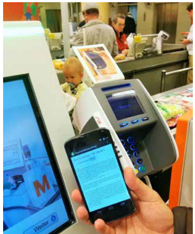
Abbildung 2: Der Bezahlvorgang beim Detailhändler ist erfolgreich, als letzter Log-Eintrag wird die kryptografische Bestätigung durch die Karte angezeigt.

Mit einer zweiten Command-APDU wird nun das gewünschte EMV-Applet selektiert (Listing 2). Falls das PSE-Applet mehrere EMV-Applets zur Wahl anbietet, so erfolgt die Wahl des zu verwen-