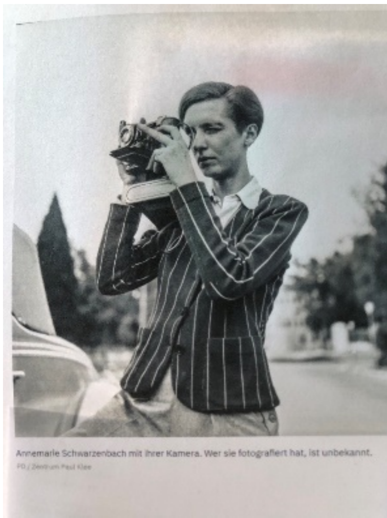
Abb. 8 Annemarie Schwarzenbach mit ihrer Kamera. Wer sie fotografiert hat, ist unbekannt. (April 2021, Annemarie Schwarzenbach – Rebellin im 5-Stern-Hotel | Berner Zeitung (online aufgerufen am 15.5.2021)