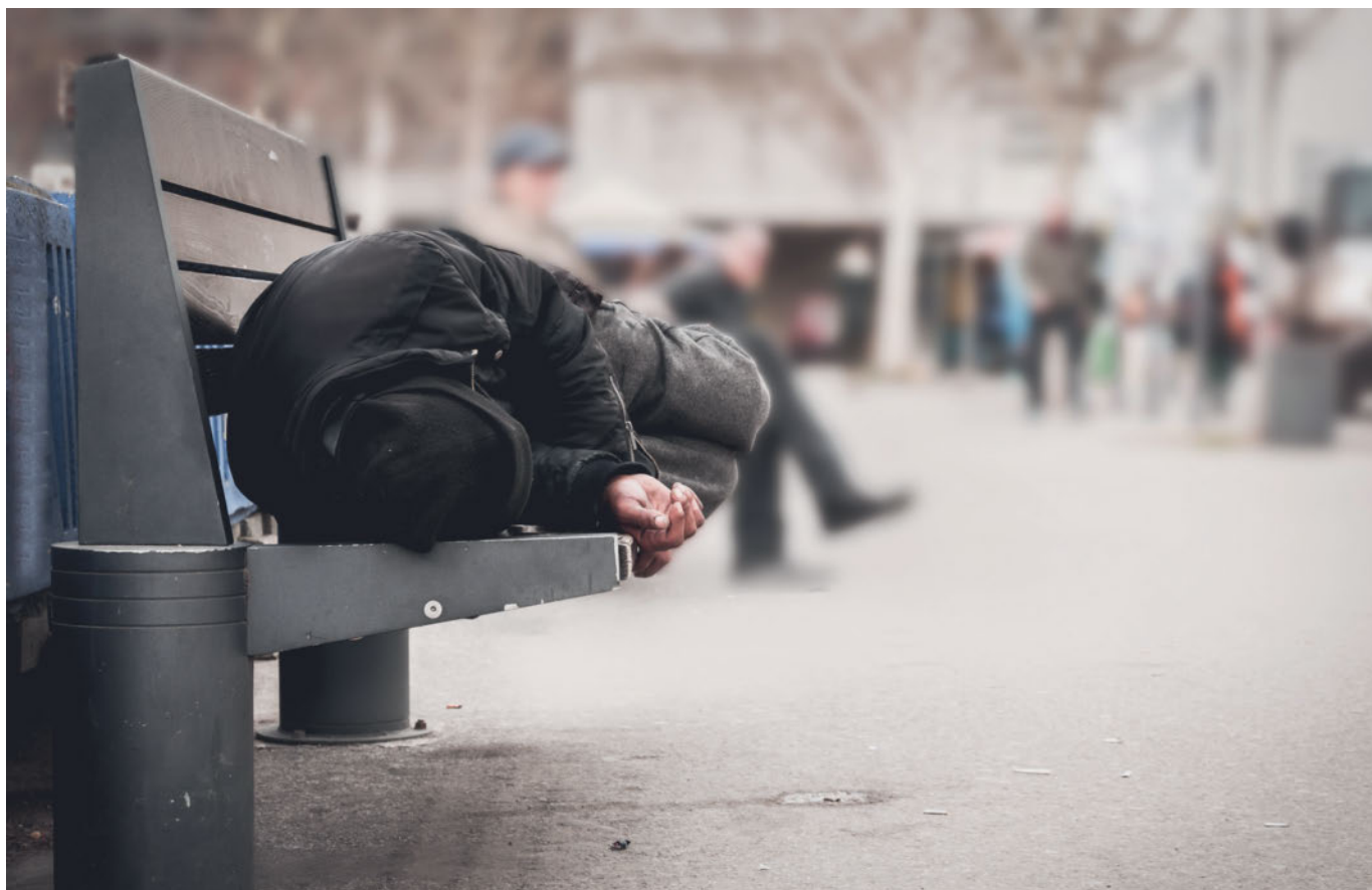
Der Eintritt in ein vertraglich abgesichertes Wohnen ist für Menschen ohne gültigen Aufenthalt in der Schweiz bereits aus strafrechtlichen Gründen massiv erschwert.

soziale, materielle und emotionale Unterstützung eher erwarten, da in der Stadt die gleiche Sprache gesprochen wird oder dort Menschen leben, mit denen sie bereits Kontakt haben.