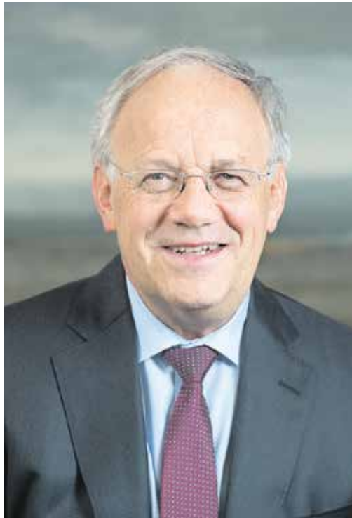
Bundesrat Johann Schneider-Ammann

Für mich als Arbeits- und Bildungsminister bedeutet dies, dass wir Sorge zu unserem Bildungssystem tragen müssen. Auch vor dem Hintergrund der angespannten Finanzlage der öffentlichen Hand gilt: Bildung ist die beste Investition in unseren innovationsfähigen Standort. Dabei sind nicht nur die Schweizer Universitäten, Forschungsanstalten und Fachhochschulen von eminenter Bedeutung, sondern auch unser weltweit fast einzigartiges duales Bildungssystem. Dieses garantiert, dass Theorie und Praxis Hand in Hand gehen. Denn Innovation ist bei uns – anders als in manch anderen Ländern –