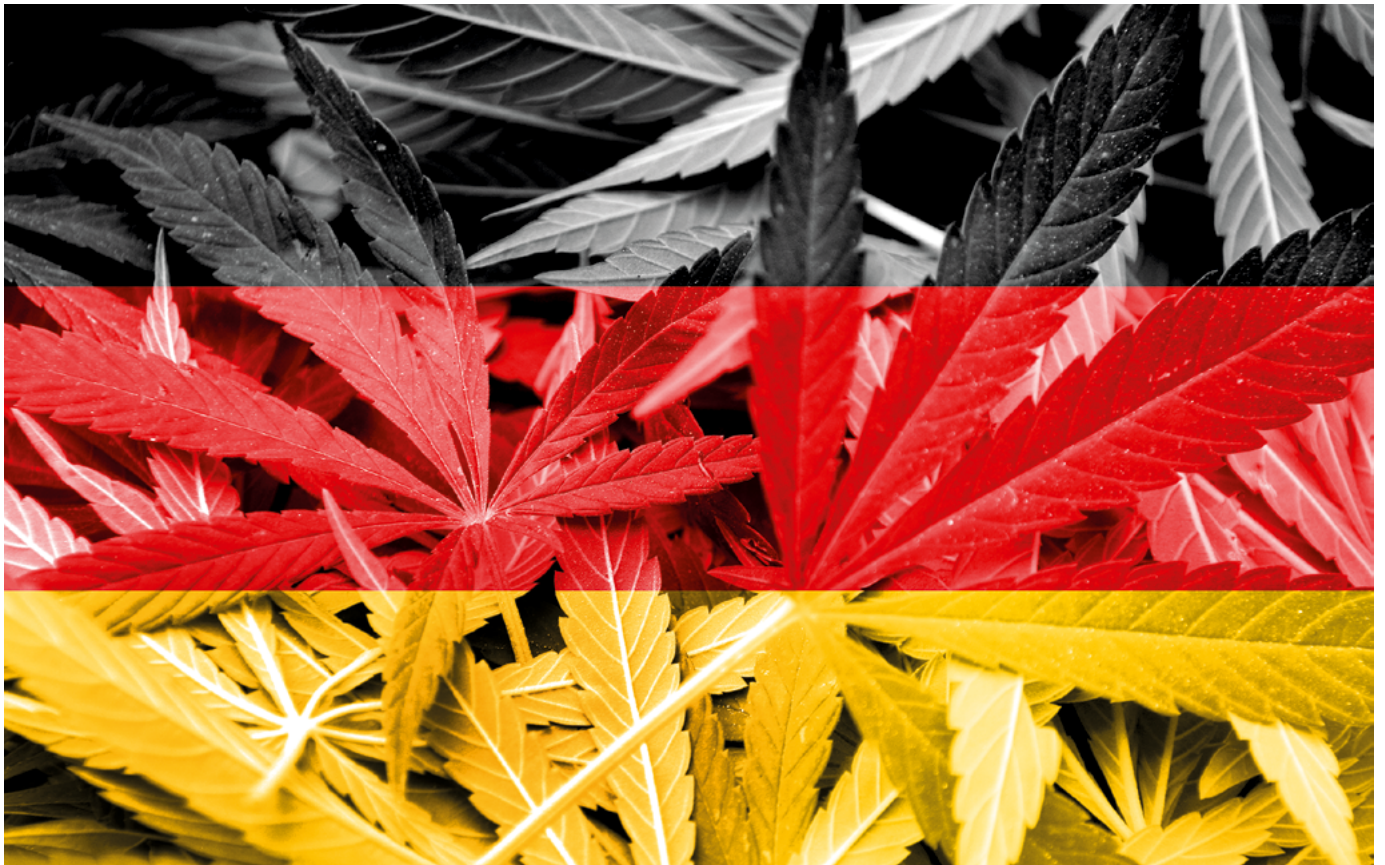
Der Konsum von Cannabis soll in Deutschland ab 1. April 2024 legalisiert werden.