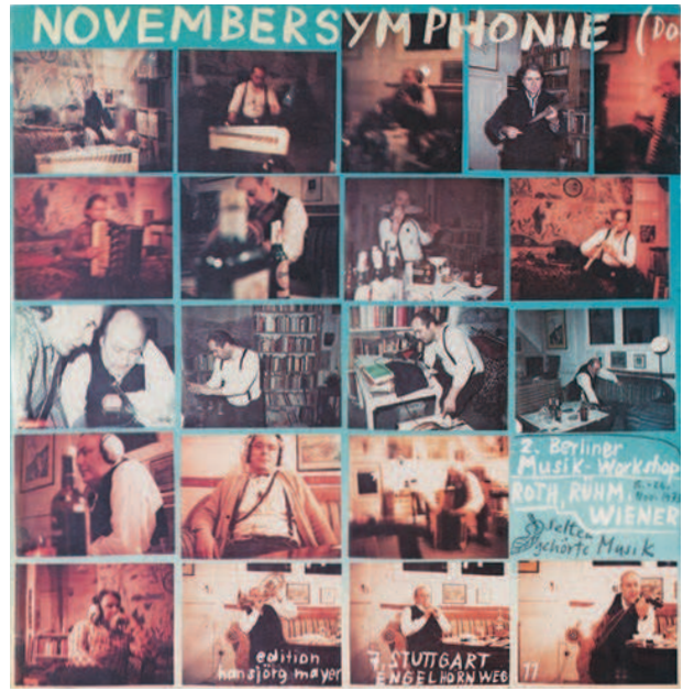
Image 3: Selten gehörte Musik, Novembersymphonie, 1973, couverture © Dieter Roth Estate, Courtesy Hauser & Wirth

Un tel dévoilement de la réalité est présent dans le deuxième vinyle de musique rarement entendue , l'album Novembersymphonie ( Symphonie de novembre ) (voir image 3). Il fut enregistré deux ans avant le Romentalquartett, en novembre 1973 à Berlin. Pour le genre symphonique, le groupe était également bien en selle et conçut une forme en quatre mouvements: le dernier mouvement s'appelle Subito ( 72 Bagatellen ), où l'on entend distinctement les références à l'École de Vienne, la seconde et la « première » (extrait audio 2). Il s'agit de fragments d'une improvisation enregistrée dans l'apparte-