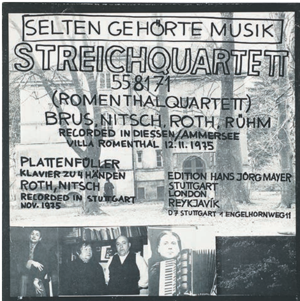
Image 1: Selten gehörte Musik, Romenthalquartett, 1975, couverture © Dieter Roth Estate, Courtesy Hauser & Wirth