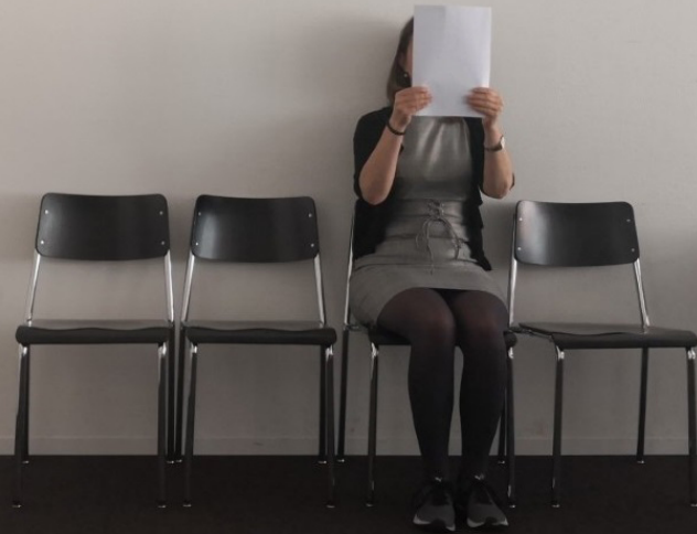
Abb. 1: Titelblatt