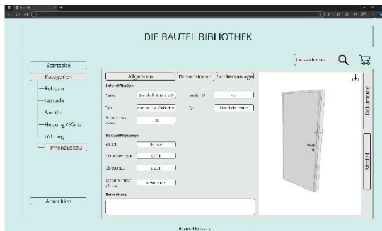
Abbildung 2: Entwurf einer online Bauteilbibliothek (eigene Darstellung, Hostettler)

auf etwas vgl. dem Urban Mining Index (Rosen, 2020) abstützen zu können. Neue Technologien wie die durch künstliche Intelligenz unterstützte Planung, werden neue Planungsmöglichkeiten eröffnen und komplexe Planungssituationen anwenderfreundlicher gestalten. Um diesen hohen Grad an Technologisierung und maschineller Verarbeitung zu erreichen, bedarf es angepasster Informationssysteme und der konsequenten und korrekten Anwendung von offenen Standards.