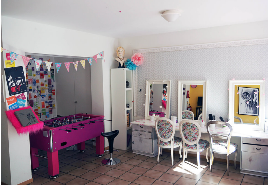
Abb. 1: Raumeinrichtung