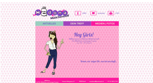
Abb. 3: Startseite