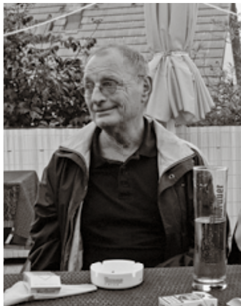
Günter Brus in the restaurant Sterzbauer in Graz, 1.10.2012