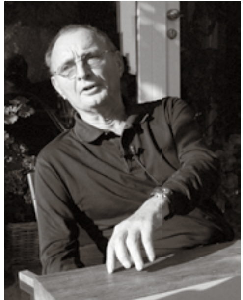
Günter Brus in seinem Garten in Graz, 1.10.2012