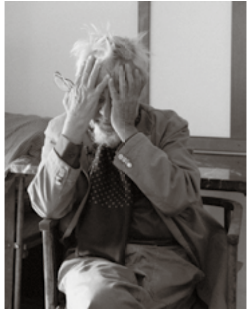
Arnulf Rainer in his flat in Vienna, 28.9.2012

During our conversation, Rainer repeatedly analyses interpersonal constellations and tries to identify psychological mechanisms in the collaborations between artists. Alone among our conversation partners, however, he regards collaboration as of lesser importance when compared to the – for him – more intense experience of working on his own. He also rejects the extreme alcohol consumption that was usual in Roth's circle, and to which all our other conversation partners frankly confess.