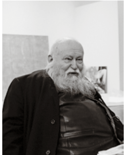
Hermann Nitsch in seinem Museum im österreichischen Mistelbach, 20. 2. 2013

Nitsch geniesst es sichtlich, mit den in unserer Runde beteiligten Musikspezialisten ein Fachgespräch führen zu können, und erläutert seine Art der Strukturpartituren, die Probenarbeit und die musikalischen Vorbilder. Auf seine Bitte holt sein Assistent Partituren von Aktionen, die das Gesagte anschaulich demonstrieren. Er empfindet es als besonderes Talent, dass er jeweils andere Musik beim Komponieren höre. Offenkundig hat er sich auch die unterschiedlichsten Einflüsse einverleibt und greift nun in einer sehr persönlichen Weise vielfältig auf diese zurück: Ganz natürlich wechselt Nitsch im Gespräch von Anton