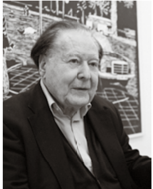
Gerhard Rühm in der Christine König Galerie, Wien, 29.9.2012

einer Spiegelwand nahe eines grossen Fensters mit Blick auf einen Stadtpark hinzusetzen – Konfekt und Getränke werden gereicht. Auf Kunstlicht kann verzichtet werden, der stürmische Herbstnachmittag lässt später während des Gesprächs die Lichtverhältnisse aber immer düsterer werden. Dafür wird Gerhard Rühm beim Erzählen lebhafter: Anfänglich entschuldigt er sich, dass er sehr müde sei; davon ist im Gespräch aber kaum noch etwas zu spüren: Er erzählt uns von vielen neuen herausfordernden Projekten, besonders Editionen seines umfangreichen eigenen Schaffens – was ihn während unseres Interviews auch zwischenzeitlich ans Telefon ruft.