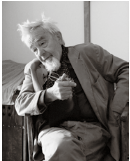
Arnulf Rainer in seinem Atelier in Wien, 28.9.2012

Rainer analysiert im Gespräch immer wieder zwischenmenschliche Konstellationen und versucht, psychologische Mechanismen in der Zusammenarbeit von Künstlern zu benennen. Für ihn sind diese kaum dokumentierbaren zwischenmenschlichen Vorgänge interessanterweise untrennbare künstlerische Bestandteile solcher Kollaborationen. Als einziger unserer Gesprächspartner wertet er für sich diese Form der Zusammenarbeit jedoch ab, gegenüber dem für ihn grösseren Intensitätserlebnis des alleinigen Arbeitens. Auch dem hohen Alkoholkonsum, der in Roths Umfeld üblich war – wie alle anderen in den Gesprächen ebenso freimütig bekennen –, steht Rainer ablehnend gegenüber.