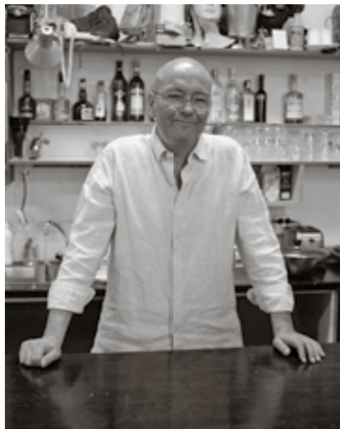
Björn Roth an der Bar seines Ateliers in Álafoss, Island, 22. 6. 2013