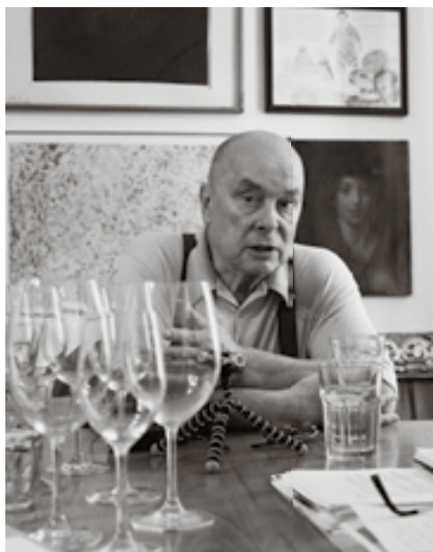
Oswald Wiener in the Viennese apartment of his daughter, 26.9.2012

restaurateurs for many years. Wiener still remembers an incredible number of details and names and narrates everything in a very factual manner, though also clearly coloured with emotional undercurrents. Several joint experiences with Roth in Iceland seem to touch him deeply, even today. The conversation is also otherwise thoroughly entertaining, for Wiener is extraordinarily eloquent and his mood improves as he tells his tales. The background remains unchangingly serious, however, which is immediately evident when, asked about humour, he says. “I always found humour to be a form of resignation, of failure”.