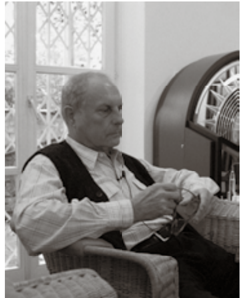
Christian Ludwig Attersee in his studio – a former synagogue – in Vienna, 27.9.2012

Even before we begin our conversation, Attersee gives us a CD documenting the concert series Attersee und seine Freunde ("Attersee and his friends"). He speaks of the idea of re-releasing the records of the Rarely heard music in similar form. Then he begins to reminisce, somewhat drily, yet also very informative in the details. Today, as back then, Attersee's own amateur music career seems to help him to feel his way keenly into Roth's musical practice. In a manner more penetrating than almost anyone else, he insists that Dieter Roth indisputably possessed abilities as a music performer, but that he knew how to hide them. The Rarely heard music was something unique, unrepeatable, where artists, friends and enemies came together to make music. Hitherto inexistent freedoms and moods were created