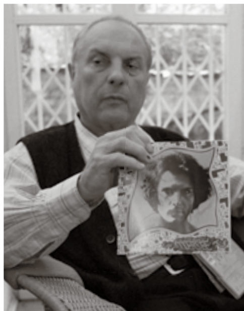
Christian Ludwig Attersee mit seiner 1981 erschienenen Single Atterseeelied / Atterseewalzer in Wien, 27.9.2012

Noch bevor wir mit dem Gespräch beginnen, beschenkt er uns mit einer CD-Dokumentation der Konzertreihe Attersee und seine Freunde . Er spricht von der Idee, in ähnlicher Form auch die Platten der Selten gehörten Musik wiederzuveröffentlichen. Dann beginnt er zu erzählen, etwas nüchtern, aber in Details sehr informativ. Attersees eigene Musikerkarriere als Dilettant scheint ihm zu helfen, sich – damals wie heute – gut in Roths Musikpraxis einzufühlen. Pointierter als fast alle anderen hebt er hervor, dass Dieter Roth durchaus Fähigkeiten als Musikinterpret hatte, diese aber zu verbergen gewusst habe. Die Selten gehörte Musik sei einmalig, unwiederholbar, da fanden sich Künstler, Freunde und Feinde beim Musikmachen zusammen. Durch diese Musik seien noch nie dagewesene Freiheiten und Stimmungen entstanden. Abenteuerlichste Tricks und schräge Ideen erzählt er uns mit abgeklärter