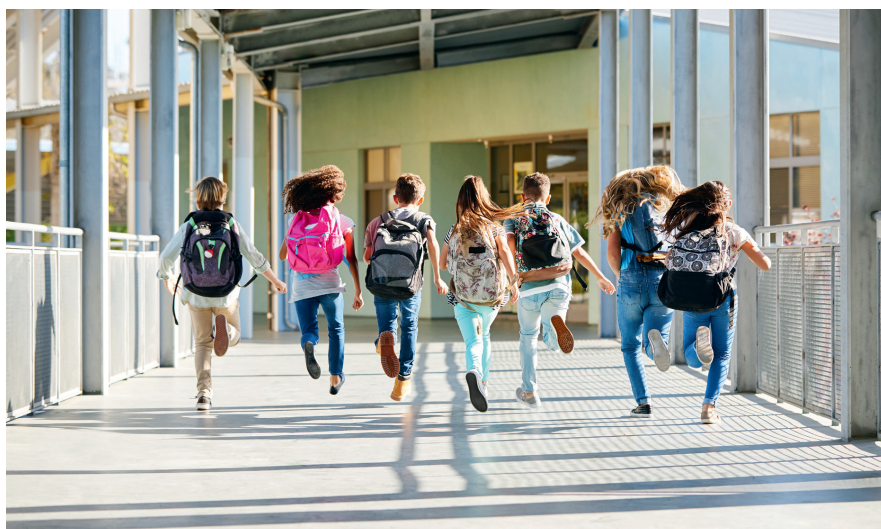
Aktiv, kreativ und unfallfrei – so macht Unterrichten Freude.