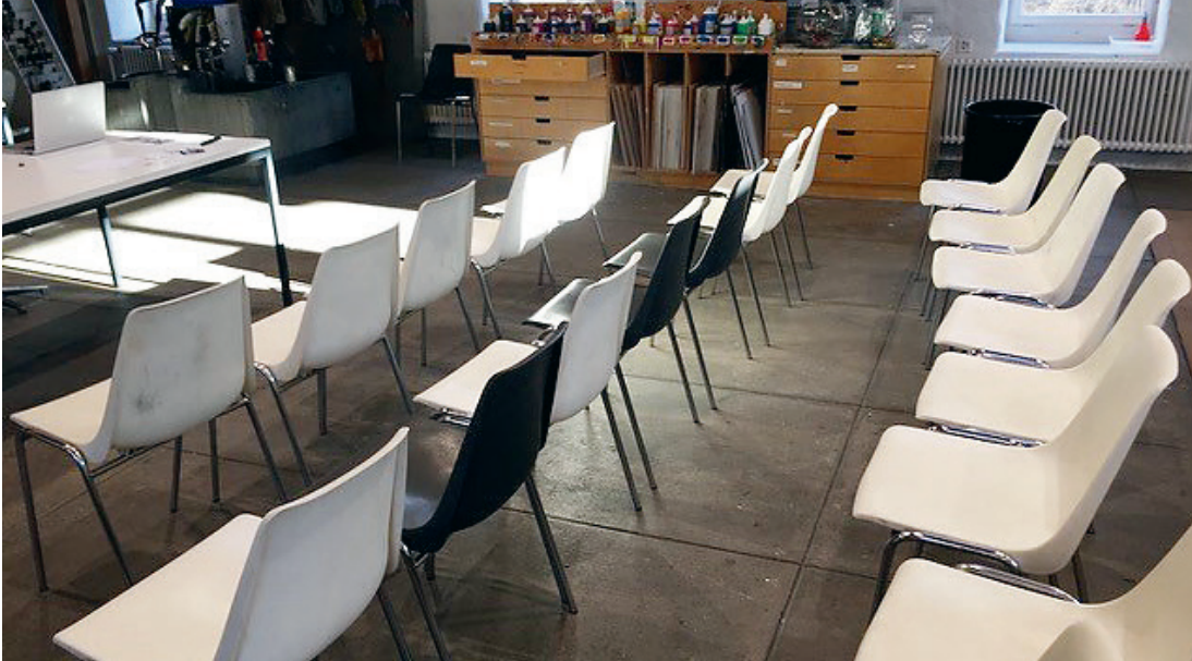
Vorlesungsbestuhlung im Schwerpunktfach Bildnerisches Gestalten.

Bildungswege. Viele angehende Primarlehrpersonen haben auf Sekundarstufe II das Gymnasium (oft ein musisch-pädagogisches Schwerpunktfach) oder die Fachmittelschule (FMS) mit Berufsfeld Pädagogik besucht. Doch worin unterscheiden sich die beiden Bildungswege?