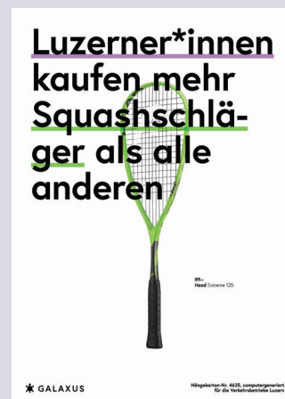
Ausgewählte Beispiele einer Plakatkampagne von Digitech/Galaxus (CH)