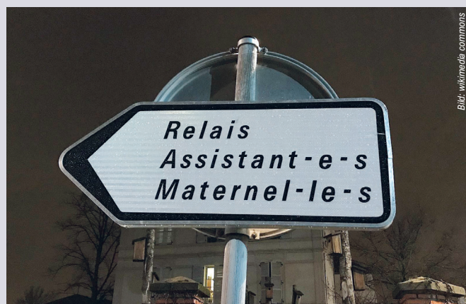
gedegerte Hinweistafel in Frankreich Rue Dalayrac Fontenay Bois 1

Wechselgebrauch kommt besonders dann in Frage, wenn Sätze im Singular formuliert werden müssen, und Personengruppen pauschal angesprochen werden. So kann z. B. in einem Lehrbuch zur Ausbildung von Assistenzärztinnen und -ärzten die Hauptperson im weiblichen Genus ange-