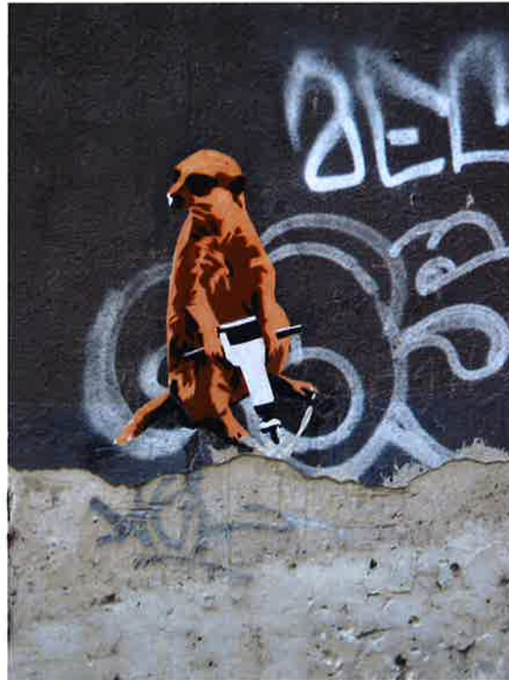
(Abb. 1: „unbekannter Künstler“ eigene Darstellung)

Eine Literaturlarbeit über die Zusammenhänge der Erwerbsarbeit, der sozialen Sicherung und sozialer Ungleichheit.