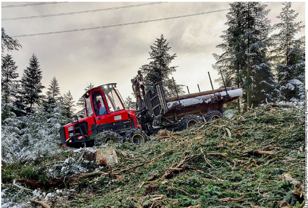
Abb 1 Eine effiziente Waldbewirtschaftung ist die Basis für eine nachhaltige Waldbewirtschaftung in ökonomischer, ökologischer und sozialer Hinsicht.

der Einfluss externer Einflussgrößen auf die Kosteneffizienz der Forstbetriebe untersucht werden. Die Arbeit soll damit Grundlagen zur Entwicklung neuer Lösungsansätze zur Wiederherstellung der ökonomischen Nachhaltigkeit in der Schweizer Waldwirtschaft liefern.