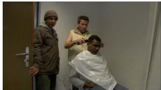
Abb. 9: Beim Friseur (La forteresse)

Im Film „La forteresse“ wird eine Szene sichtbar, welche einen Sozialraum eines Friseursalons präsentiert und unter dem Aspekt der Privatsphäre von Beruf analysiert werden kann. Die Kamera zeigt in der ersten Einstellung eine Hand auf dem Kopf eines schwarzen Mannes, welcher um die Schultern ein weisses Stück Plastik trägt. Die Tonspur verrät, dass diesem Mann die Haare rasiert werden.