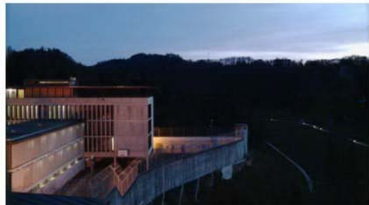
Abb. 3: Die Strafanstalten Thorberg

In den Strafanstalten Thorberg sind 180 Männer aus über 40 Nationen und unterschiedlichsten Kulturen und Religionen inhaftiert (vgl. Polizei- und Militärdirektion Kanton Bern o.J.). „Als Einweisungsründe in den geschlossenen Vollzug gelten: schwere Verbrechen, Rückfälligkeit, Gemeingefährlichkeit oder Fluchtgefahr.“ (Balzli & Fahrer Filmproduktion 2012: o.S.) Der Berner Fil-