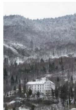
Abb. 4: Das EVZ in Vallorbe

Der Dokumentarfilm „La forteresse“ von Fernand Melgar wurde vom 3.12.2007 bis 15.2.2008 im Empfangs- und Verfahrenszentrum in Vallorbe, einer Kleinstadt im waadtländischen Jura, gedreht. In den fünf Empfangs- und Verfahrenszentren (EVZ) des Staatssekretariats für Migration SEM (in Basel, Kreuzlingen, Altstätten, Chiasso und Vallorbe) findet zunächst der Empfang der Asylsuchenden statt. Hier werden die Personalien registriert und meist findet bereits eine erste Anhörung und Befragung zu den Asylgründen statt. Die maximale Aufenthaltsdauer im EVZ beträgt mittlerweile neunzig Tage 1 . Asylsuchende, deren Gesuch nicht im EVZ entschieden werden kann, was bei der grossen Mehrheit der Fall ist, werden bis