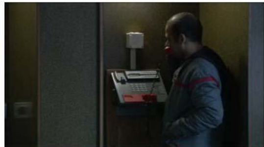
Abb. 7: Telefonat mit Nabil (La forteresse)

Für diese Stufe steht deshalb eine Sequenz im Film „La forteresse“, in welcher ein Mann, der Name bleibt unbekannt, in einer Telefonkabine telefoniert. Eine zweite Einstellung zeigt, dass sich nebenan von einer Mauer abgetrennt eine zweite befindet. Türen sind keine vorhanden, was die Privatsphäre einschränkt, weil dadurch die Gespräche mitgehört werden können. Der Mann