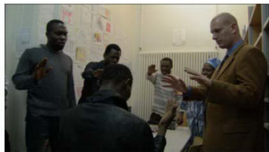
Abb. 8: Die Messe (La forteresse)

Die vierte Stufe der Privatheit nach Burkart, die häusliche Privatsphäre, beinhalten Familie und Gemeinschaft. Familien sind im Männergefängnis per se ausgeschlossen, im EVZ werden durchaus Familien aufgenommen, wie dies auch im Film „La forteresse“ sichtbar wird. Zur Untersuchung der vierten Stufe wurde jedoch eine Szene gewählt, welche sich um eine andere Art von Gemeinschaft