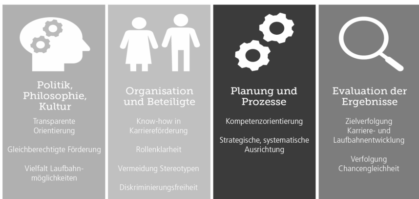
Abbildung 2: Themenfelder des Screenings. 5

Organisationen, die sich ein umfassendes, analysegestütztes Bild über ihre generelle und auf Frauen 45+ fokussierte Ausrichtung ihrer Personalentwicklung und Karriereförderung verschaffen möchten, können das mithilfe des in Zusammenarbeit mit verschiedenen Praxispartnern entwickelten Screenings tun. Die Besonderheit des Screenings liegt darin, dass Unternehmen Erfolgsfaktoren sowie Problembereiche der operativen Umsetzung erkennen können, um diese in der Folge gezielt anzugehen und die Ausrichtung ihrer Personalentwicklung und Karriereförderung nachhaltig auszurichten. Das entwickelte Screening deckt unterschiedliche Themenbereiche ab und unterscheidet vier Elemente, mit denen eine Status-Quo-Validierung vorgenommen werden kann: