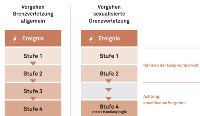
Abb. 3: Ablauf Vorgehen bei Grenzverletzungen (in: Stiftung Bündner Standard 2023e: 6)

Wie der Abb. 3 zu entnehmen ist, werden jegliche sexualisierte Grenzverletzungen die über die Stufe 2 hinausgehen, also über den Rahmen der Besprechbarkeit , umgehend auf der Stufe 4 verortet und verlangen in ihrem Umgang eine „andere Handlungslogik“ (vgl. SBS 2023e: 6).