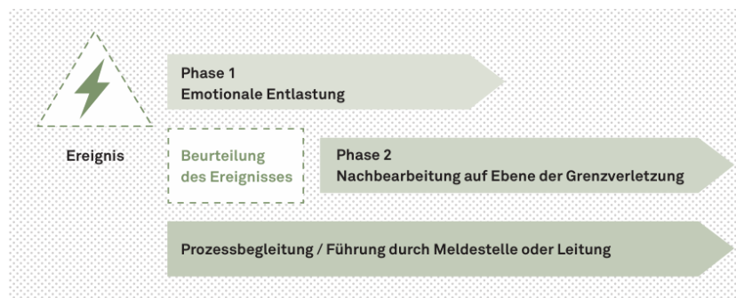
Abb. 6: Phasen der Nachsorge (in Stiftung Bündner Standard 2023g: 5)

Die Abb. 6 gibt einen Überblick über die verschiedenen Phasen der Nachsorge. Die Fachpersonen sollen gemäss den Mindestanforderungen des Bündner Standards ausserdem gezielt darin geschult werden, in akuten Situationen sofort untereinander