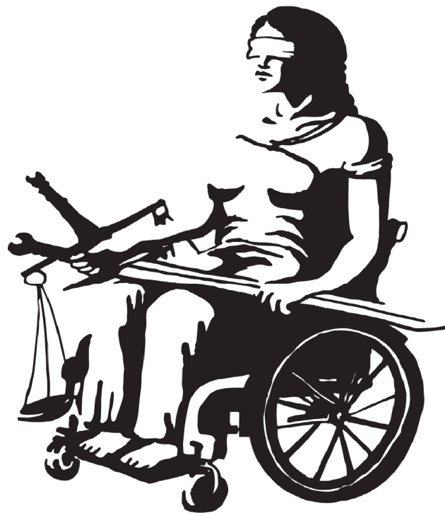
Abb. 1: Justitia. Eigene Darstellung

Im Kontext von Menschen mit schwersten und mehrfachen (Entwicklungs-) Beeinträchtigungen