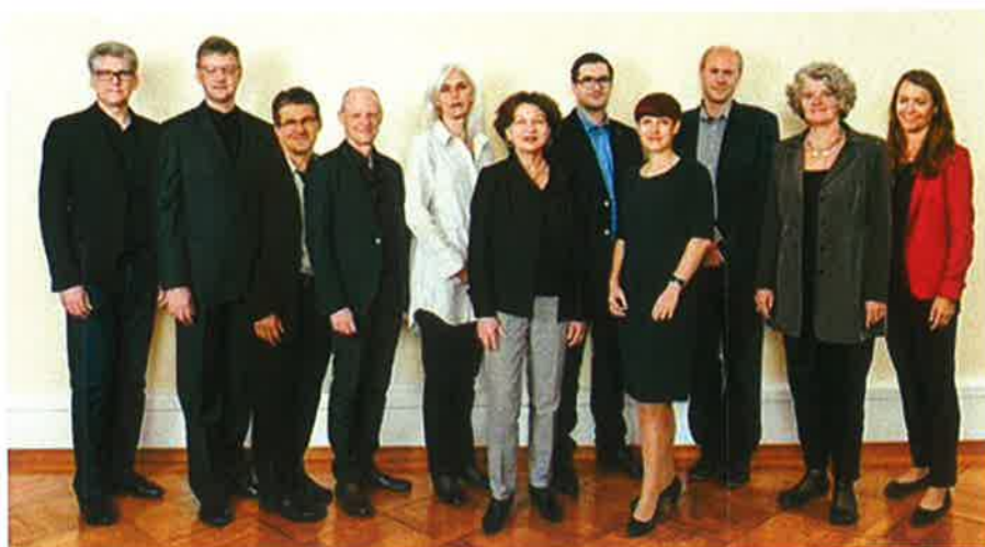
Abb. 2 Hochschulleitung HSA FHNW (vgl. FHNW 2015b: o.S.)