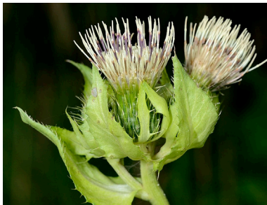
Wächst auf feuchtem Boden: die Kohldistel.

Das Team um Eva Knop vom Institut für Ökologie und Evolution untersuchte dies erstmals mit einem Experiment an Kohldisteln. Um die Wirkung künstlicher Beleuchtung zu untersuchen, wurden Strassenlaternen in den Berner Voralpen aufgestellt. Normalerweise werden Kohldisteln von Nachtfaltern und Käfern bestäubt, welche die farblich unauffällige Pflanze über ihren Geruch finden. Beim Experiment stellte sich heraus, dass Kohldisteln, welche künstlichem Licht ausgesetzt sind, viel seltener von bestäubenden Insekten besucht werden als solche in Dunkelheit. Eine Erklärung dafür ist laut Projektleiterin Knop, dass die Bestäuber von der Lichtquelle angezogen und dadurch von den Blüten weggelockt werden.