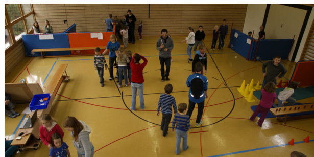
Forschermorgen in der Turnhalle.