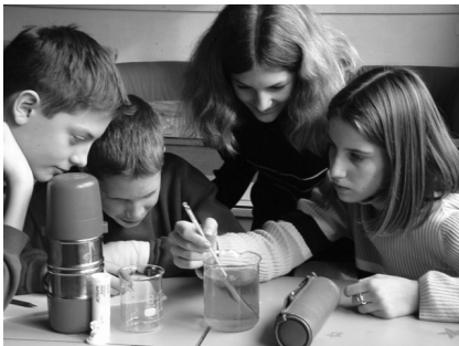
Abbildung 3: Beispiel eines PB-Items für die 6. Klasse zum Handlungsaspekt «Informationen erschliessen» und dem Themenbereich «Planet Erde».

Plane eine Untersuchung, um herauszufinden, welche Wirkungen unterschiedliche Temperaturen auf die Geschwindigkeit haben, mit der sich Brausetabletten auflösen.