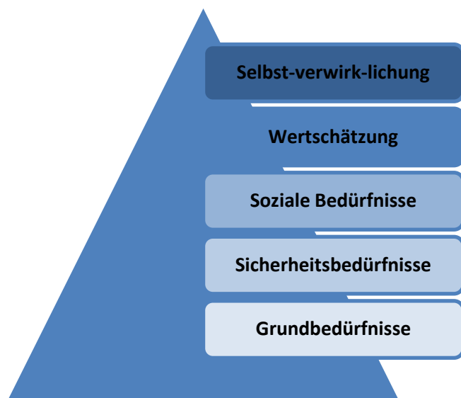
Bedürfnispyramide nach Maslow (1954)

Auch ist nicht nur die Grösse des Sozialen Netzwerkes massgebend für mehr soziales Kapital, sondern auch positive Beziehungen zu Menschen aus möglichst unterschiedlichen Bereichen erhöhen die Gruppenzugehörigkeit.